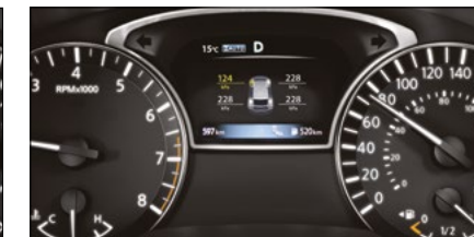
SISTEMA DE MONITOREO DE PRESIÓN DE LLANTAS (TPMS)*