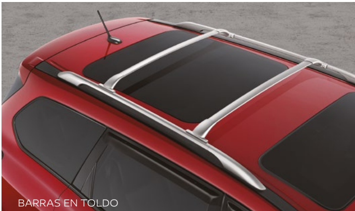
BARRAS EN TOLDO