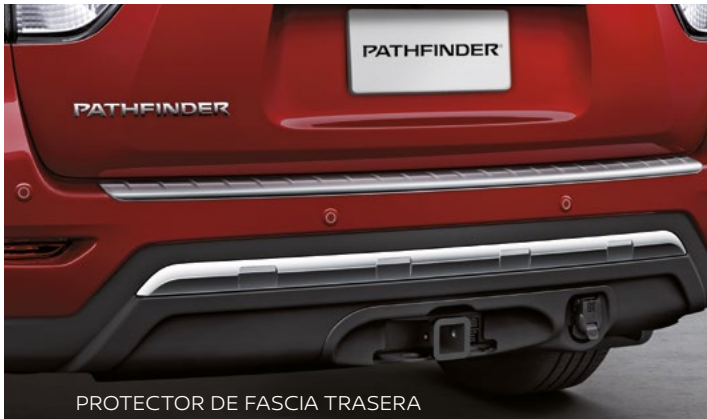
PROTECTOR DE FASCIA TRASERA