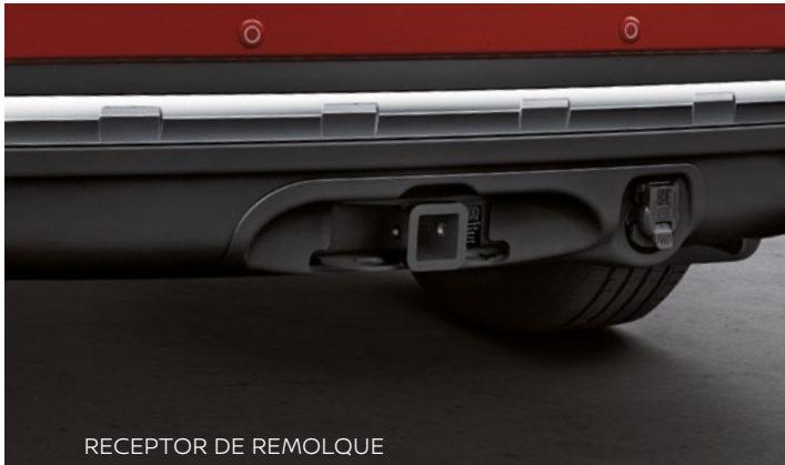
RECEPTOR DE REMOLQUE