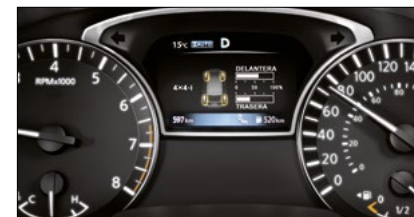
DISTRIBUCIÓN DE TORQUE 4X4