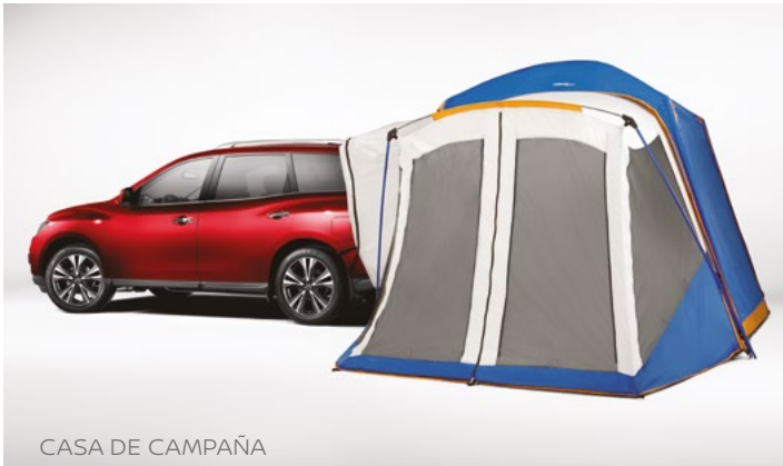
CASA DE CAMPAÑA