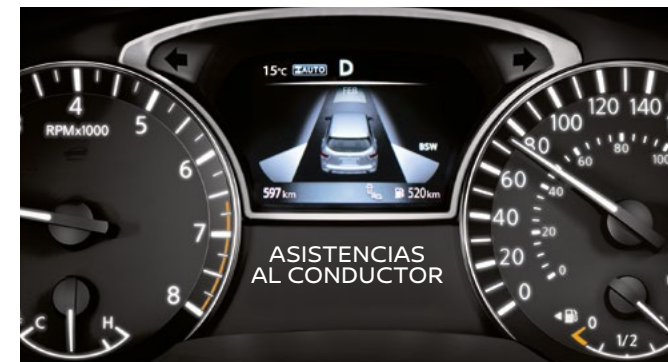
ASISTENCIAS AL CONDUCTOR

El innovador Nissan Advanced Drive-Assist® Display despliega toda la información que necesitas sobre tu conducción, pasando de una pantalla a otra y controlándolo todo desde el volante.